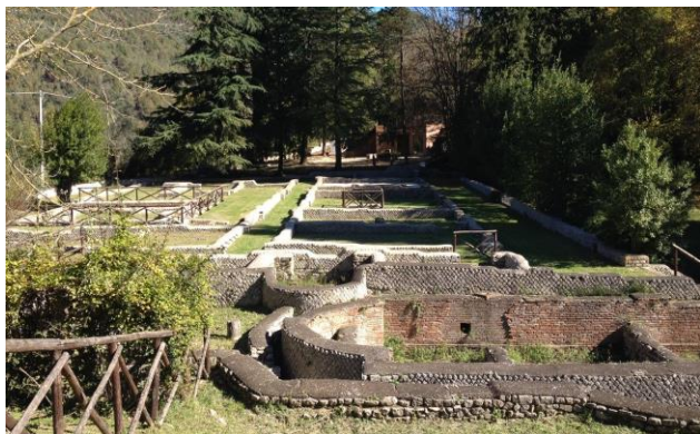
Villa di Orazio

Informativa di assunzione di responsabilità: il Club Alpino Italiano promuove la cultura della sicurezza in montagna in tutti i suoi aspetti. Tuttavia, la frequentazione della montagna comporta dei rischi comunque ineliminabili e pertanto con la richiesta di iscrizione all'escursione il partecipante esplicitamente attesta e dichiara di non aver alcun impedimento fisico e psichico alla pratica dell'escursionismo, di essere idoneo dal punto di vista medico e di avere una preparazione fisica adeguata alla difficoltà dell'escursione della quale conferma aver preso visione delle caratteristiche.