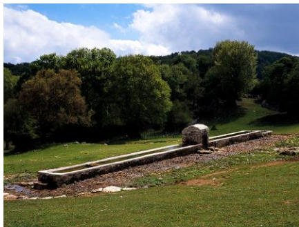
Il fontanile basso di Campitello