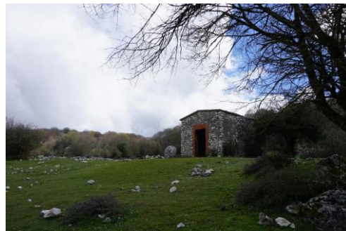
La chiesetta del Pratone